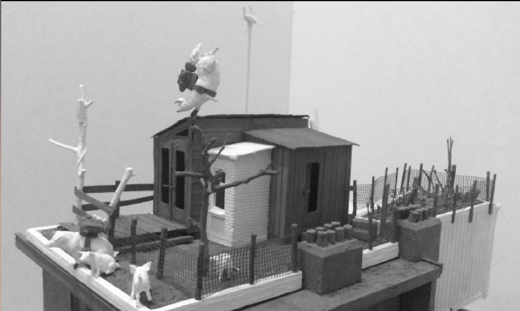
Stalla in de Gloria, rooftop extension and basecamp of El Capitano!