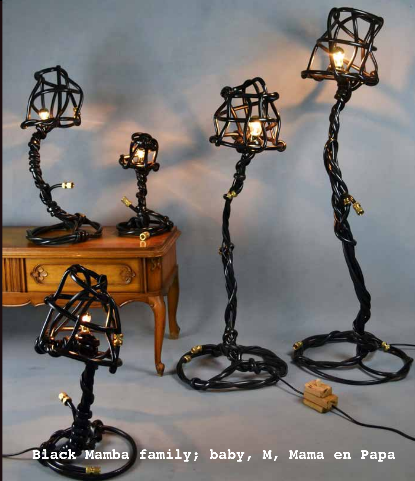
Black Mamba family; baby, M, Mama en Papa