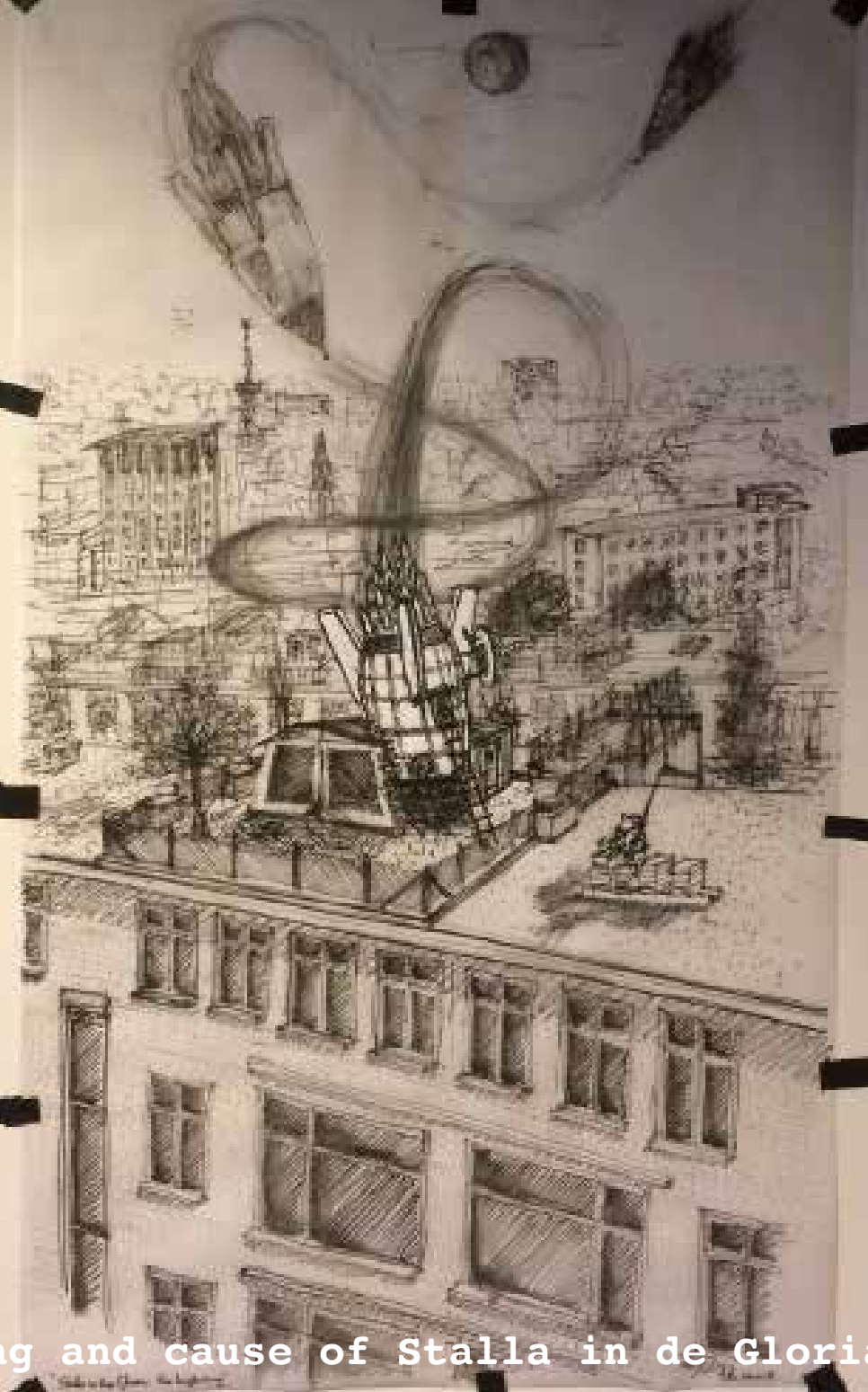
Starting and cause of Stalla in de Gloria!