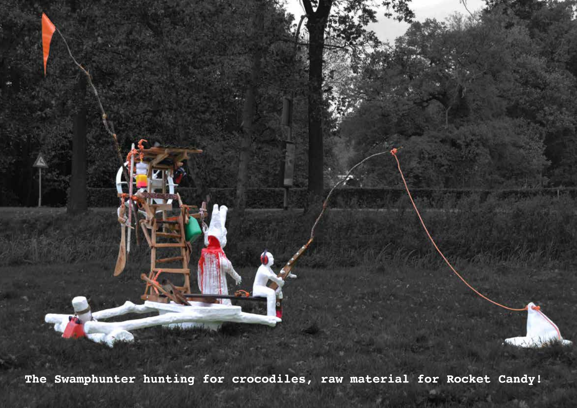
The Swamphunter hunting for crocodiles, raw material for Rocket Candy!