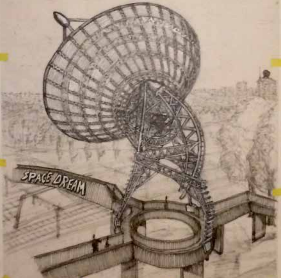
Antenna on "luchtsingel".