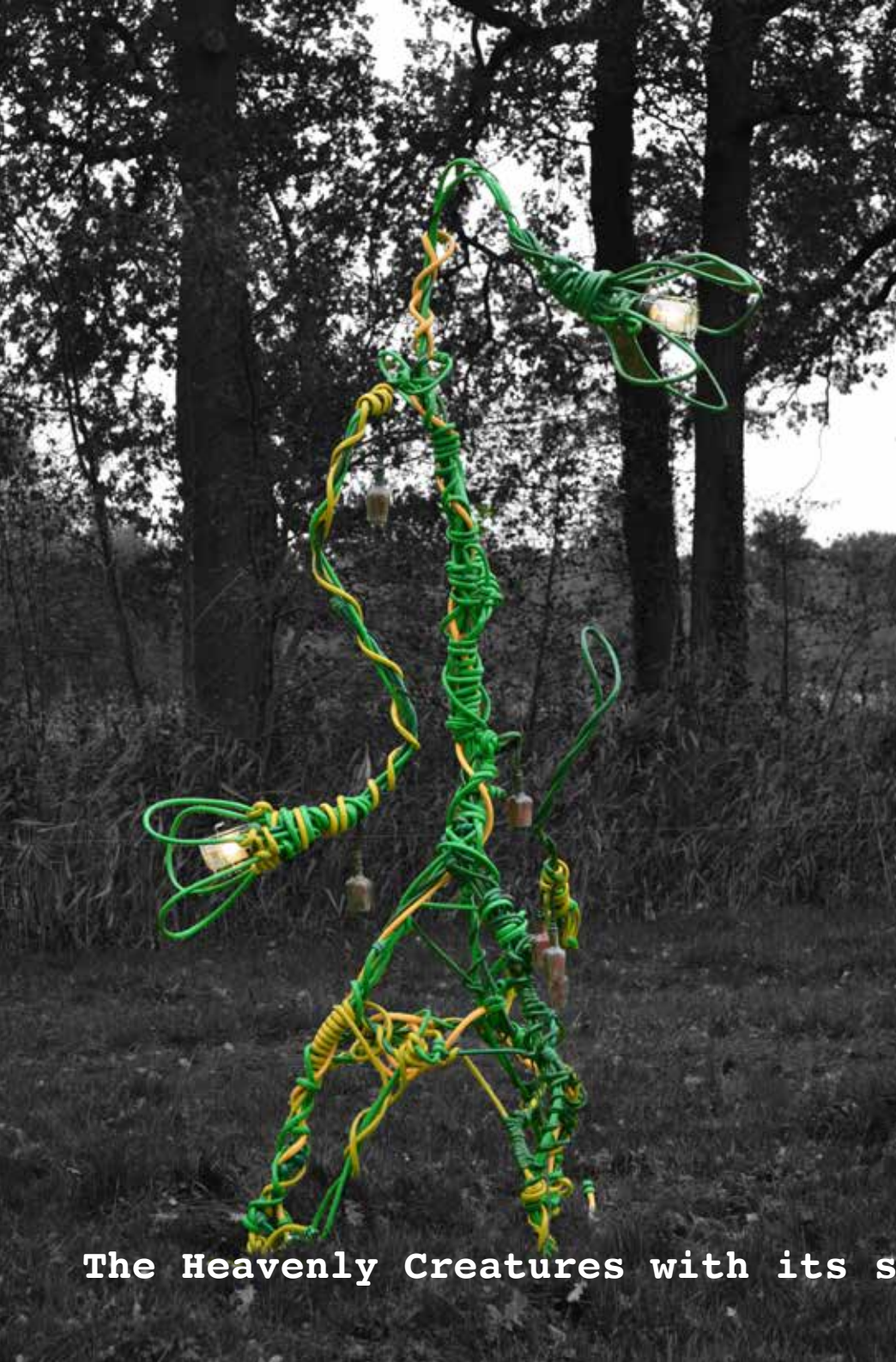
The Heavenly Creatures with its seeds!