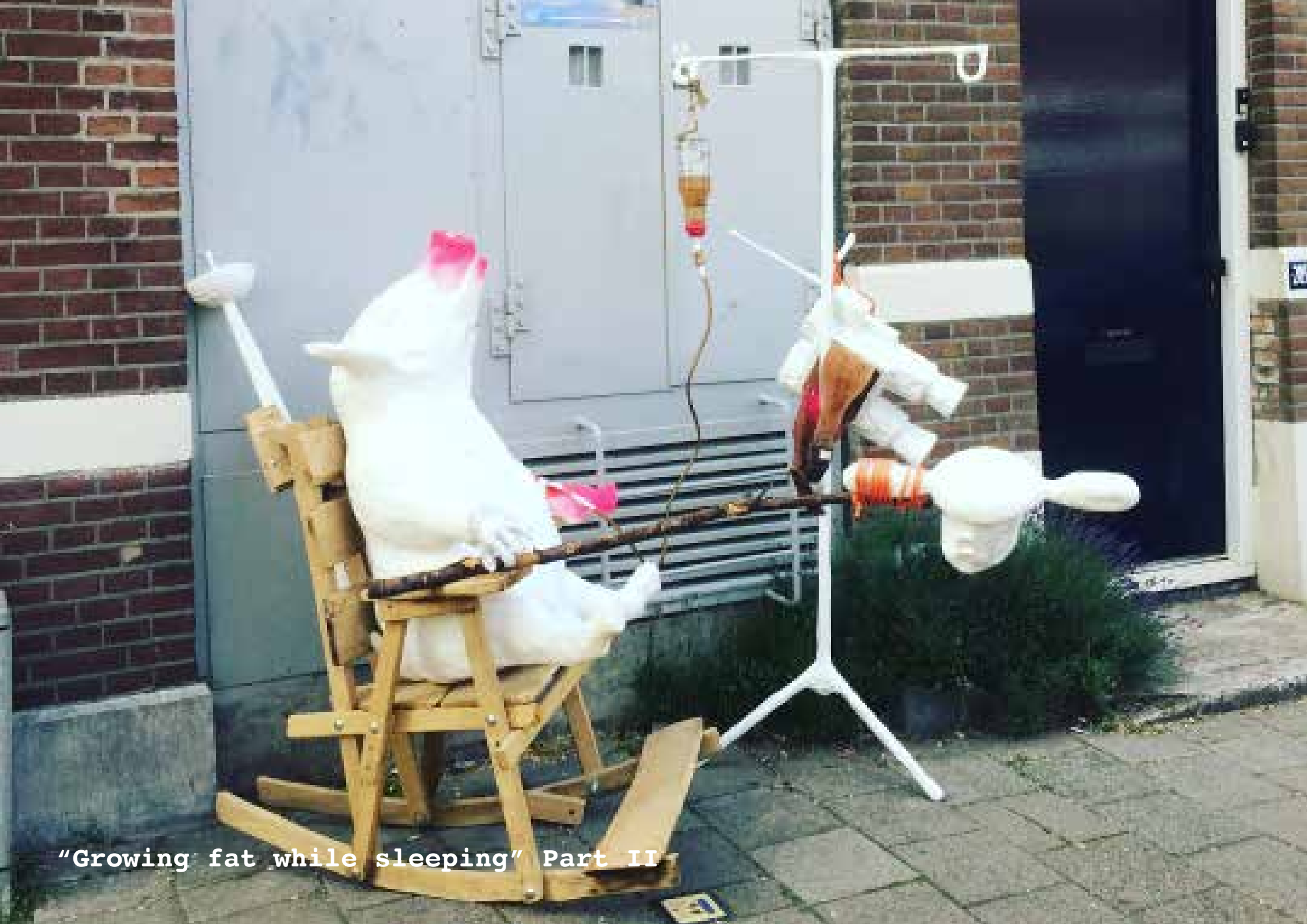
"Growing fat while sleeping" Part II