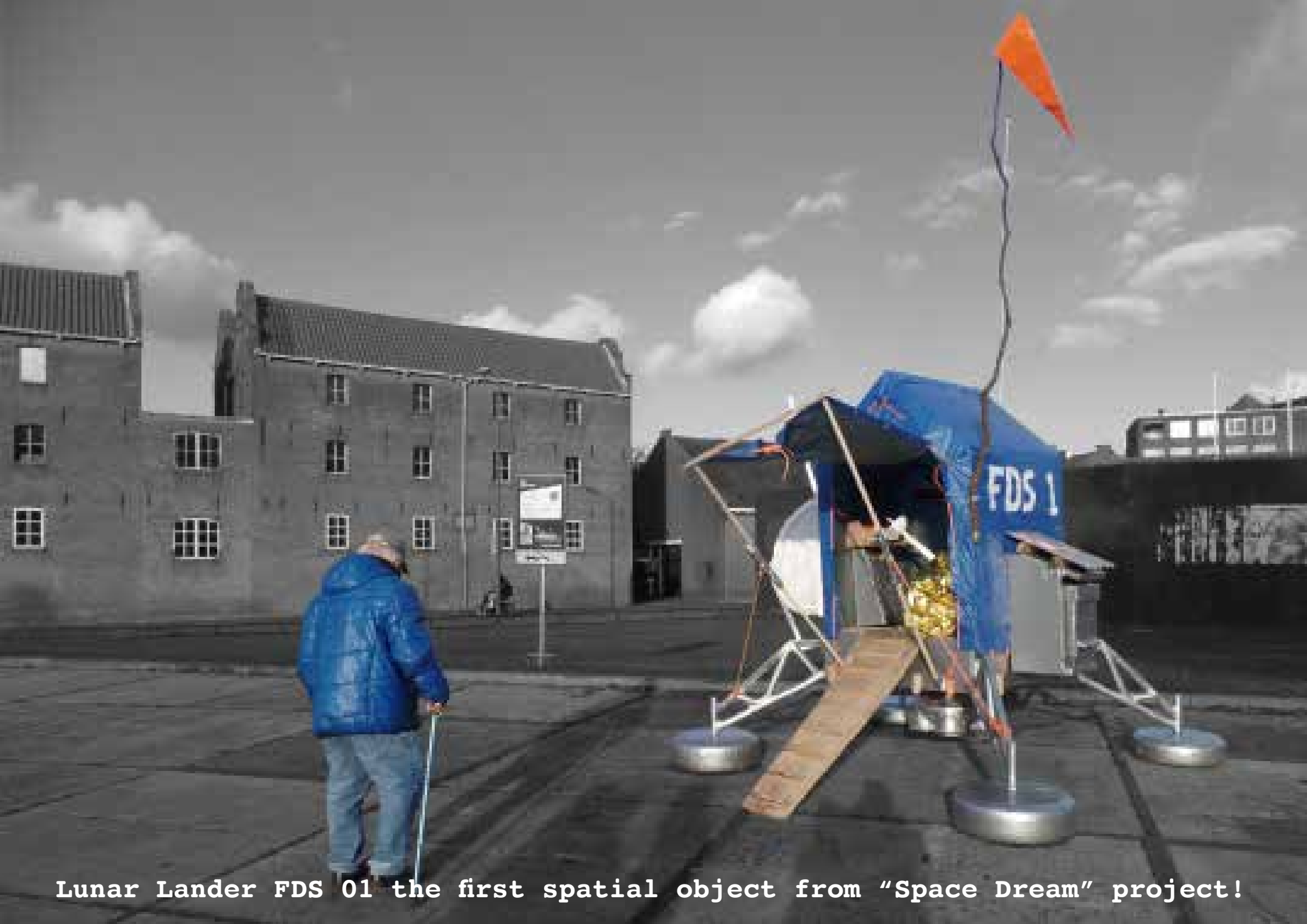
Lunar Lander FDS 01 the first spatial object from "Space Dream" project!