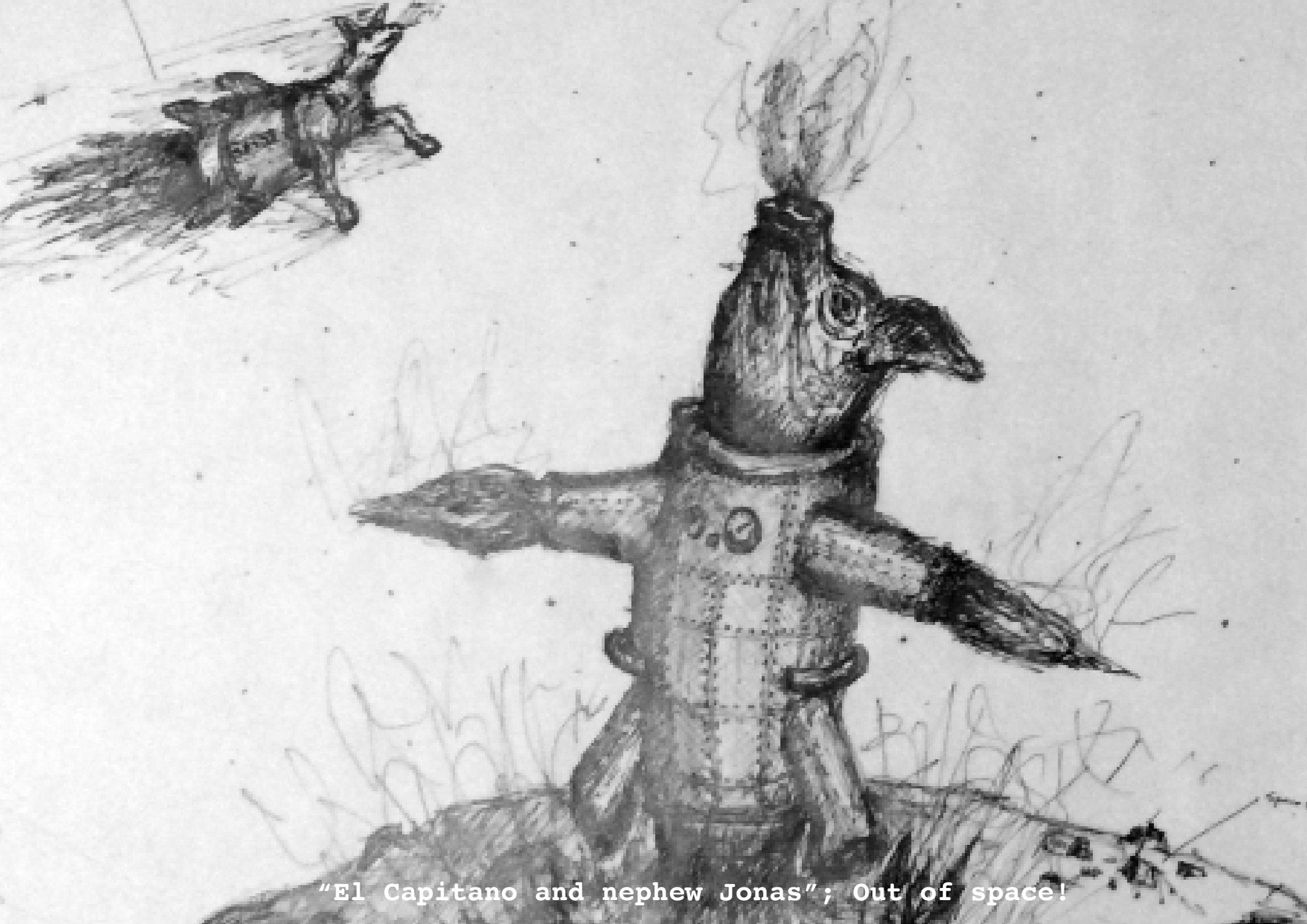
"El Capitano and nephew Jonas"; Out of space!