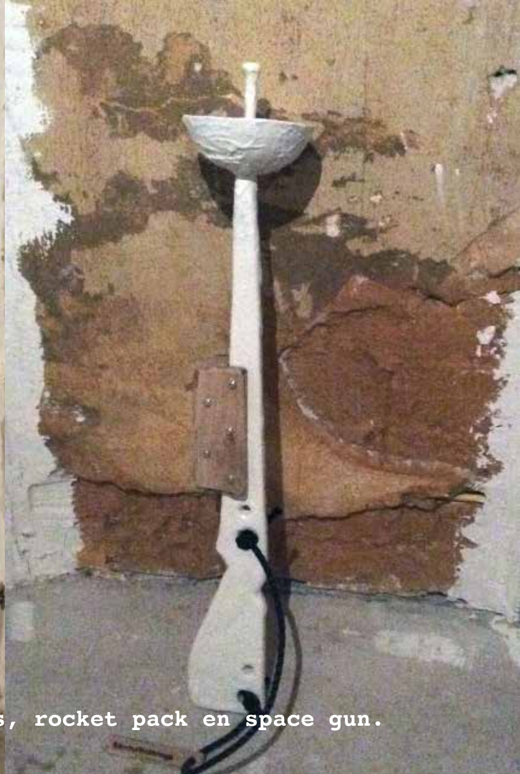
Attributen van de "Space Pigs"; infuus, rocket pack en space gun.