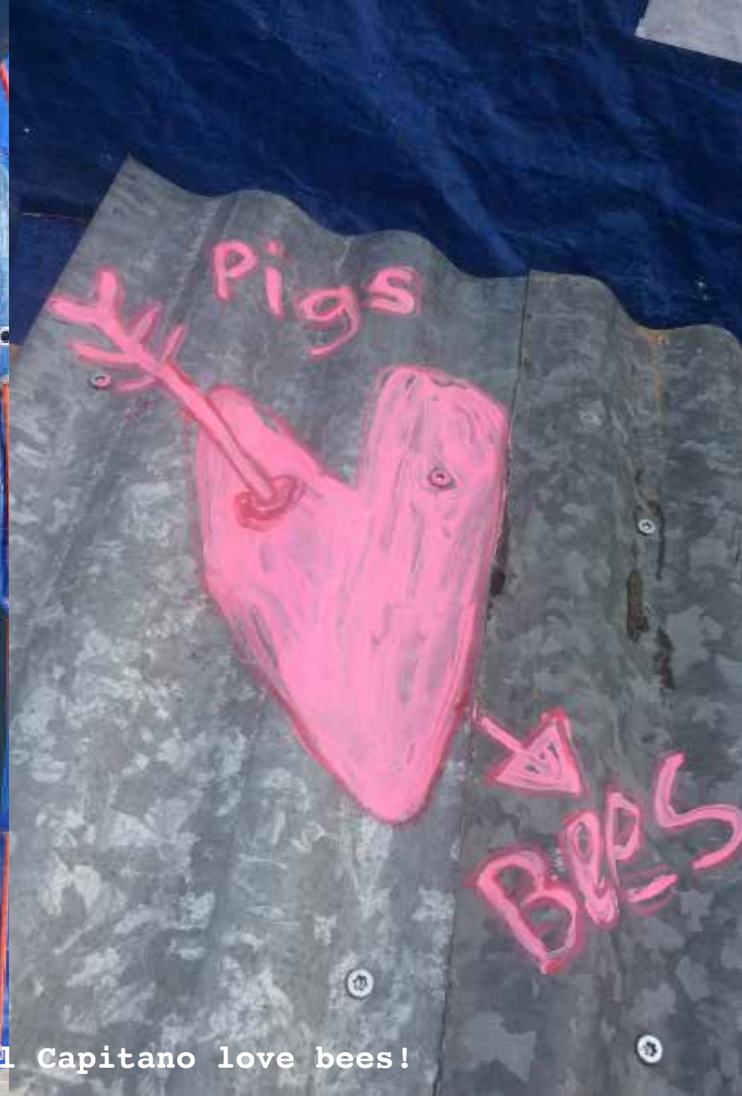
"FDS 01" "Maanlander"; El Capitano love bees!