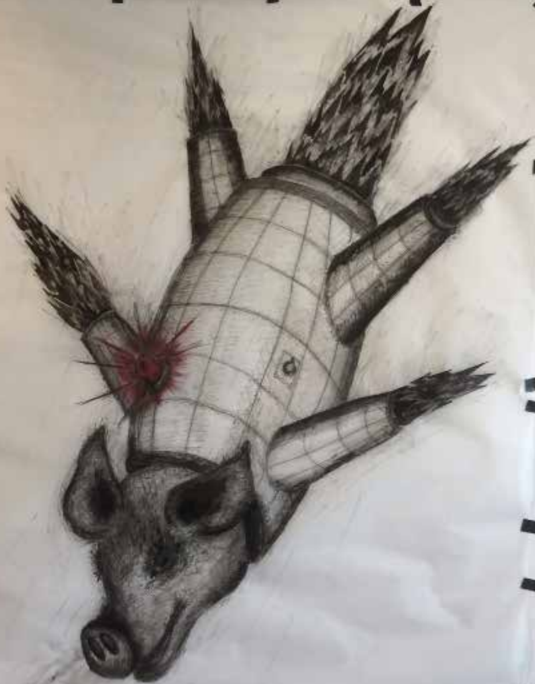
"El Capitano"; flying and protesting