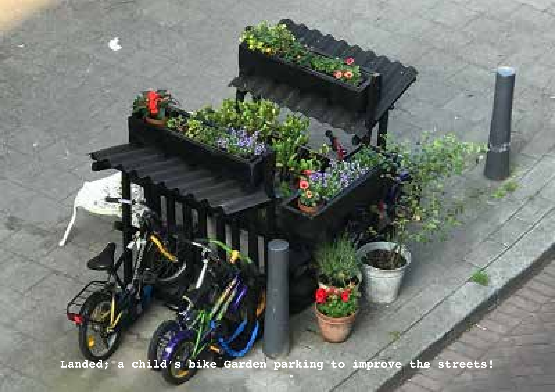
Landed; a child's bike Garden parking to improve the streets!