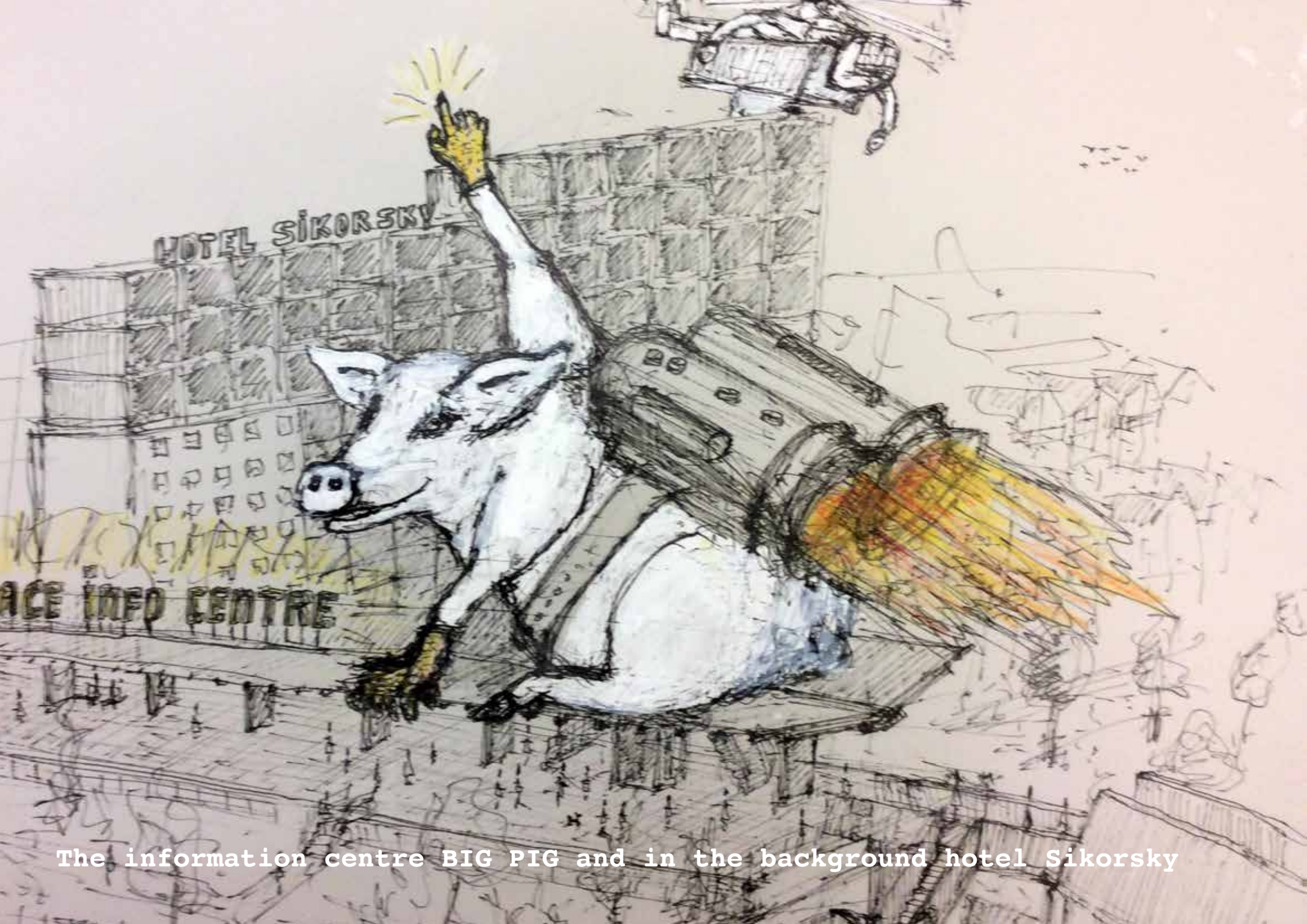
The information centre BIG PIG and in the background hotel Sikorsky