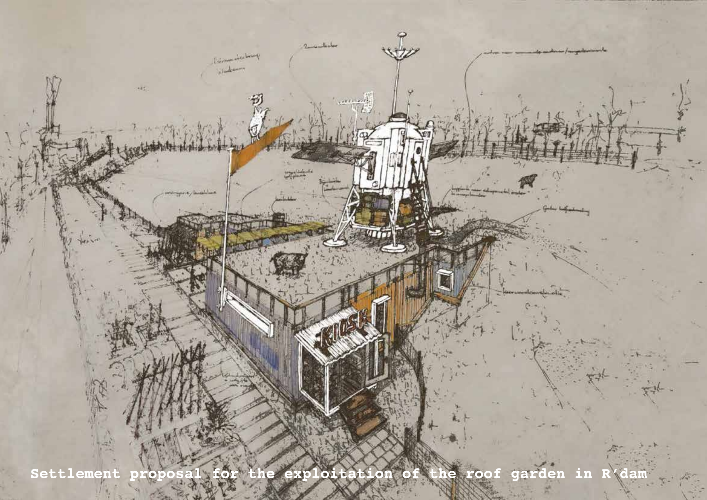
Settlement proposal for the exploitation of the roof garden in R'dam