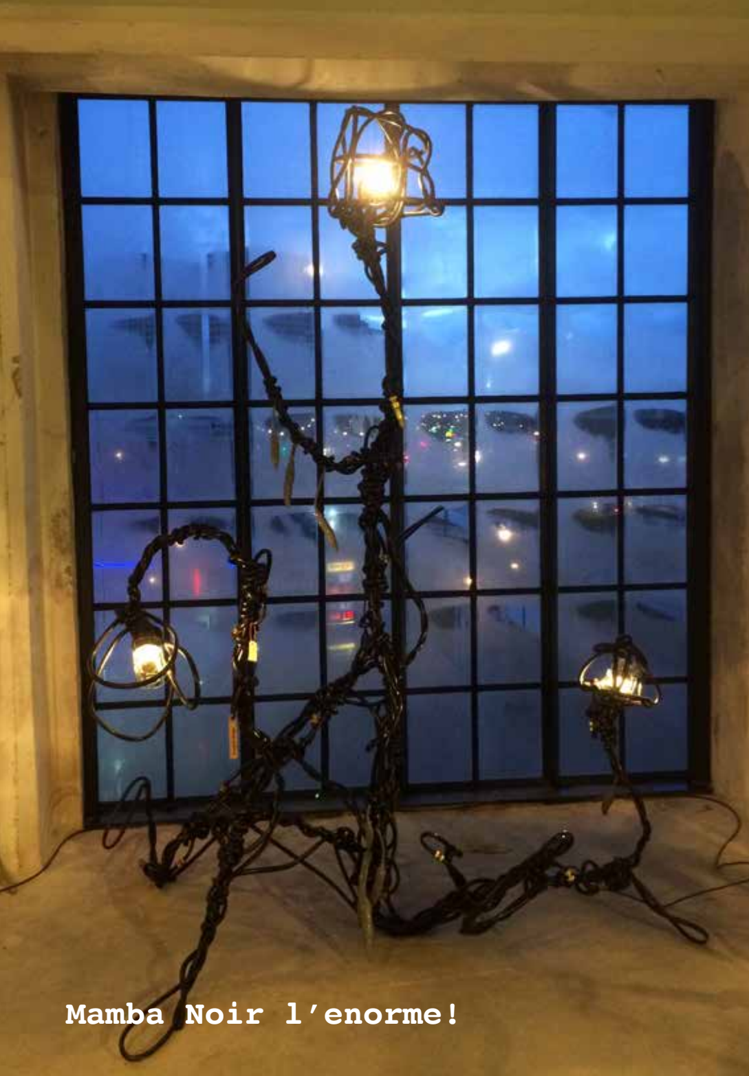
Mamba Noir l'enorme!